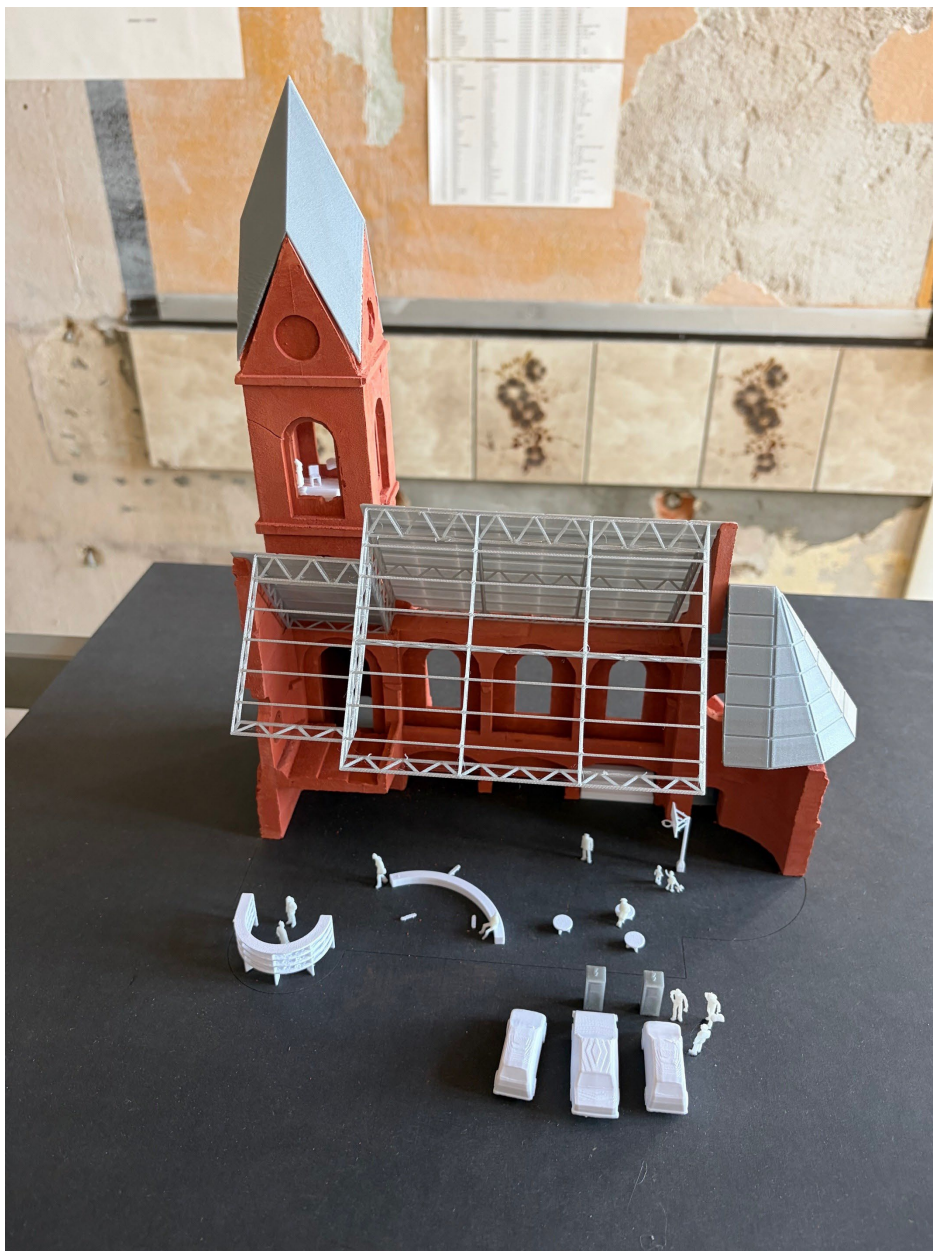
Modell einer möglichen Transformation der historistischen neuen Waldauer Kirche in Bernburg mit Jugendzentrum, E-Tankstelle und mietbarem Turmzimmer.