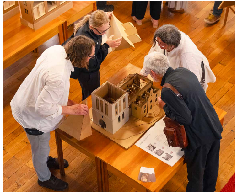
Ausstellung Historische Baukunst und neue Gemeinschaften, Modelle und Pläne von Studierenden aus dem Wintersemester 2025/26, Entwurf Sakralraumtransformation der TU Dresden