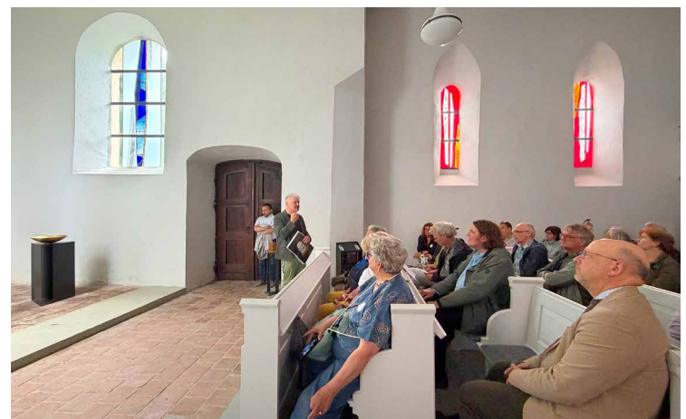
Dorfkirche Nutha Fenster, Prinzipalien, Ostwand: Gerlach Bente