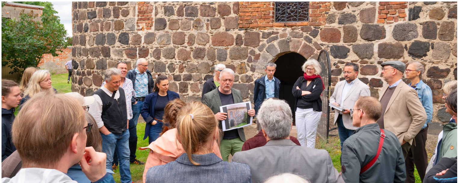
Dorfkirche Kermen Fenster: Günter Grohs